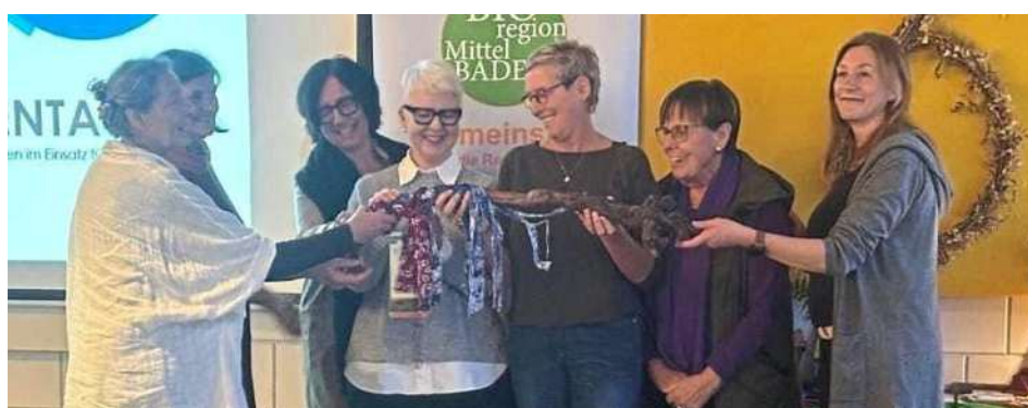
Bei einer feierlichen Veranstaltung wird der Staffelstab der Rebholz-Wanderstaffel weitergegeben.