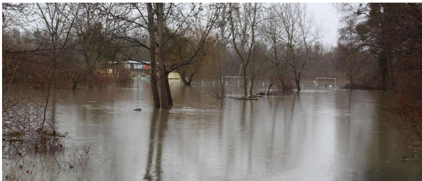
Die Extremwetterereignisse in der Region nehmen zu: Das Bild zeigt den überfluteten Bereich in der Fährstraße in Rastatt-Plittersdorf im Januar 2021.

Nach der Fertigstellung müssen die Konzepte veröffentlicht und der Landesanstalt für Umwelt gemeldet werden. Mit dem Beschluss hat der Kreistag den Weg frei gemacht für ein Projekt, das die Region auf die Folgen des Klimawandels vorbereiten soll – ohne finanzielle Risiken und mit Unterstützung des Landes.