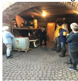
Eine Weinprobe im Hof des